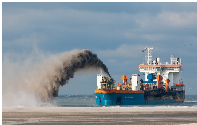
Waterbouwers aan het werk bij Maasvlakte 2.