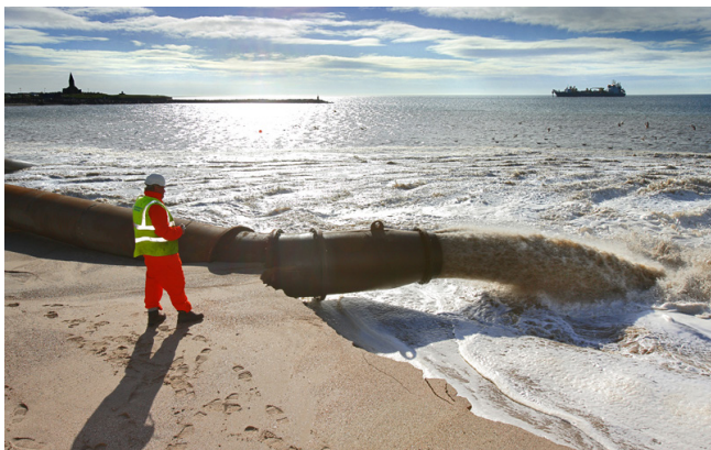
Een kubieke meter zand weegt 1.500 kilo.